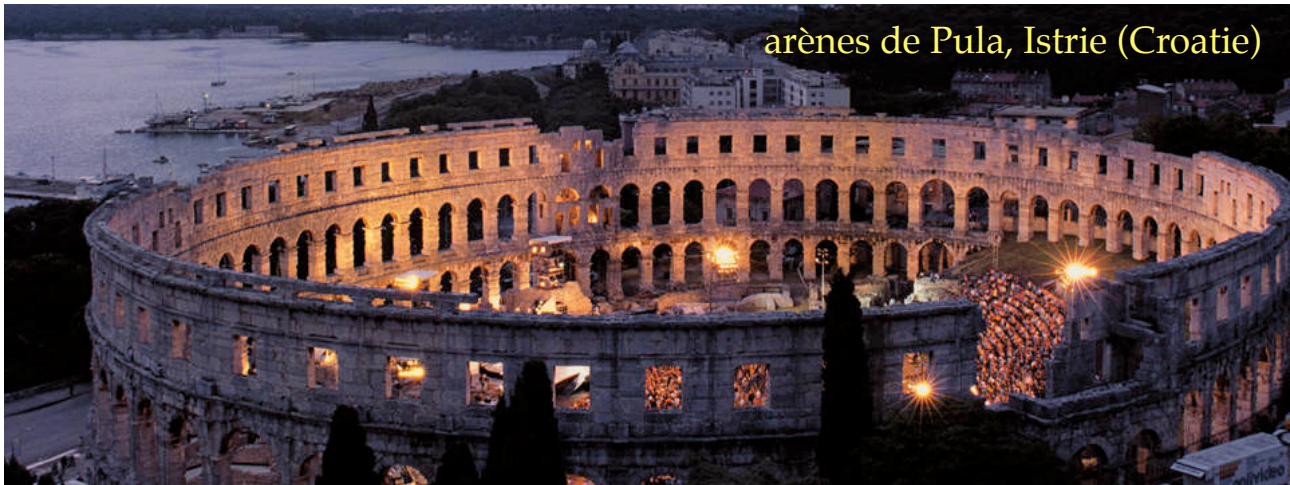
arènes de Pula, Istrie (Croatie)